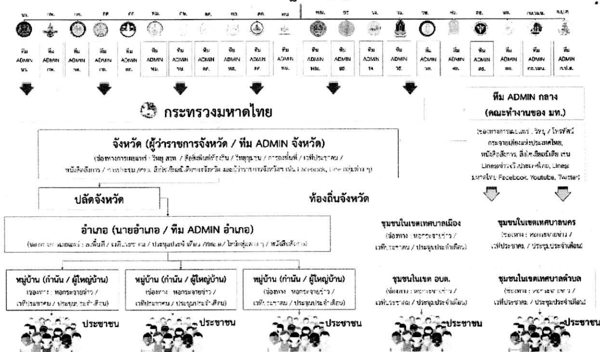
ภาพที่ ๑ ภาพรวมการกลไกการขับเคลื่อนการสร้างการรับรู้